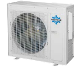
Condenseurs 18 k, 24 k et 30 k BTU/h