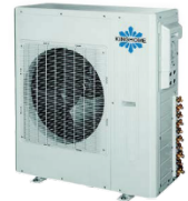
Condenseurs 36 k et 42 k BTU/h